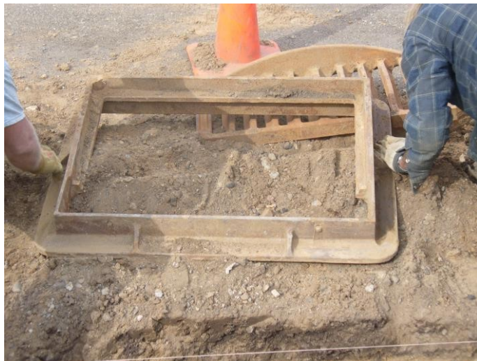
1. Retire la colada y anillos existentes o la placa de cubierta para exponer la estructura de concreto.