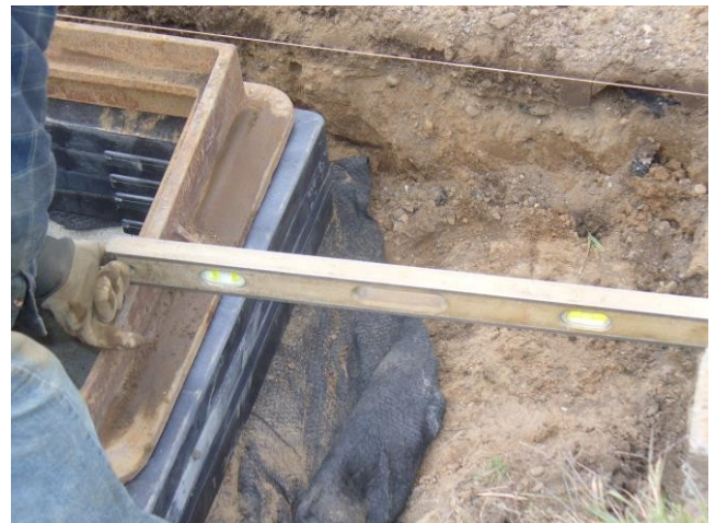
2. Estire la línea de la cuerda o coloque la regla de borde recto para determinar el ajuste de altura requerido.