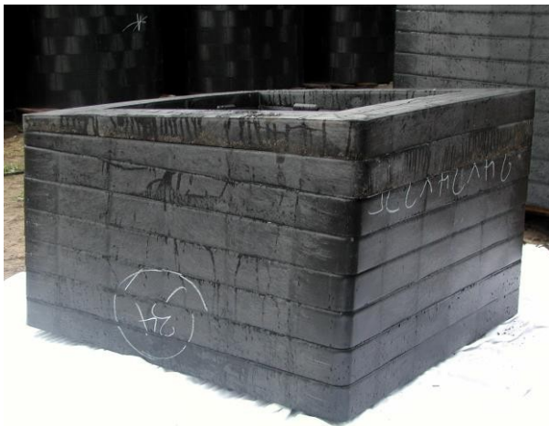
3. Combinar varias alturas de anillo, tanto en plano como en pendiente, para alcanzar el ajuste deseado. Los anillos deben colocarse con aberturas en los compartimientos hacia abajo y lengüetas que se extienden hacia la estructura o los anillos inferiores. Nota: Los anillos de pendiente se estrechan de lado a lado en ángulo para demostrar una compensación de pendiente del 1% al 3%.